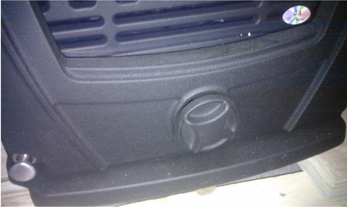
Ovan: Primärluftsintag under eldstaden