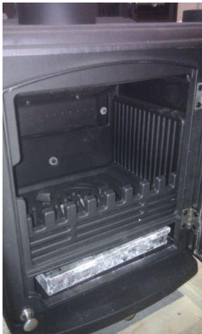
Ovan t.v: Eldstaden