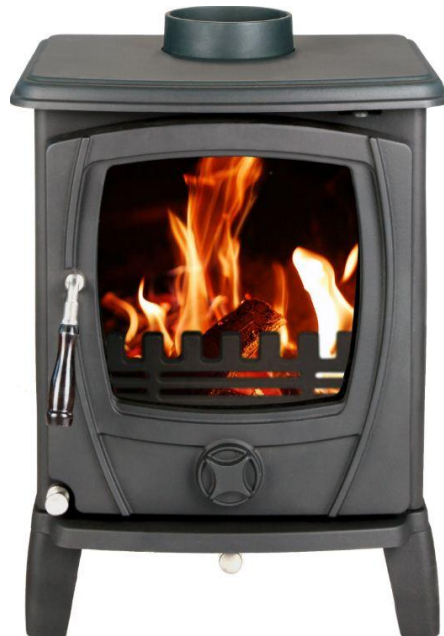
Ovan t.h. Freja rakt framifrån