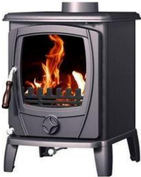
Ovan t.v: Freja snett framifrån