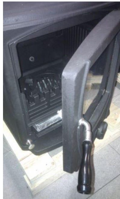
Ovan t.h: Rejäl gjutjärnsdörr